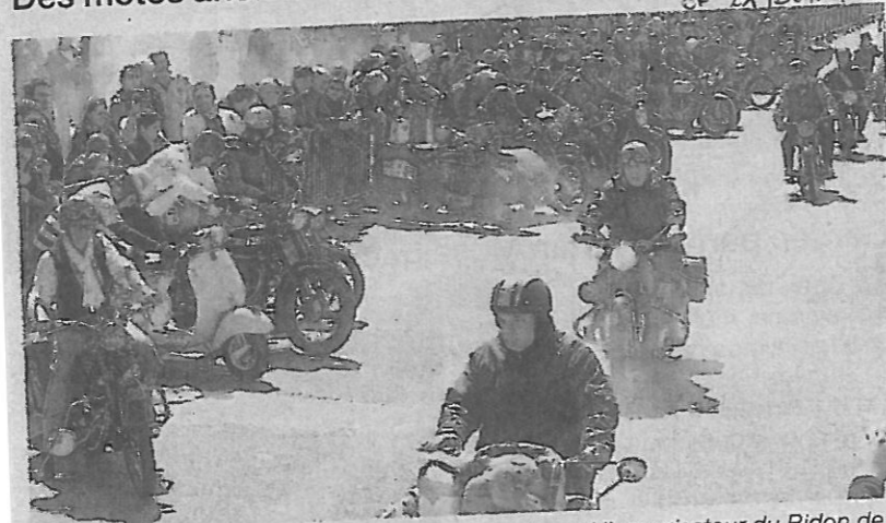
Le club des Rétro motocyclettes sarthoises est aussi l'organisateur du Bidon de deux litres, au Mans.

Le club des Rétro motocyclettes sarthoises propose dimanche 22 juin une fête de la moto sur la plaine de jeux de Changé, face au centre François-Rabelais (entrée libre).