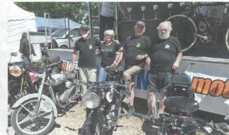
▲ Les représentants du Retro motocyclettes sarthoises sont titulaires de la Coupe Moto Légende, jusqu'à l'année prochaine.