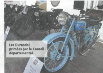
▲ Les Durandal, primés par le Conseil départemental.