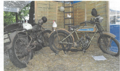
▲ Les sorties de grange du Moto-club du Lion.

a été transmise symboliquement par le Club français du cyclo sport au Retro motocyclettes sarthoises. Le RMS est ainsi récompensé pour son action en faveur des « échanges avec la grande communauté passionnée des deux roues motorisés d'époque pré 65 ». Ses 50 adhérents entretiennent et font tourner environ 150 motos populaires. ■