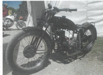
▲ Gnome et Rhône ABC de 1922. ▶