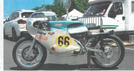
▲ König 500 (Pays-Bas) et sa "coupe étranger".